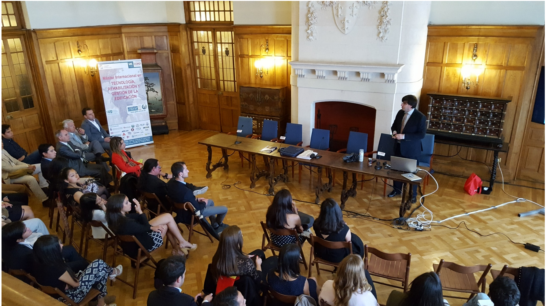
Fig. 3: Alumnos durante una de las sesiones académicas referidas de la clausura en el Palacio Real de la Magdalena (Santander) 10ª Edición